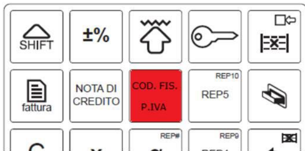
Tastiera 35 tasti